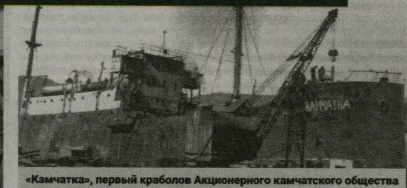
«Камчатка», первый краболов Акционерного камчатского общества

После Второй мировой войны иностранцы были полностью вытеснены с Камчатки