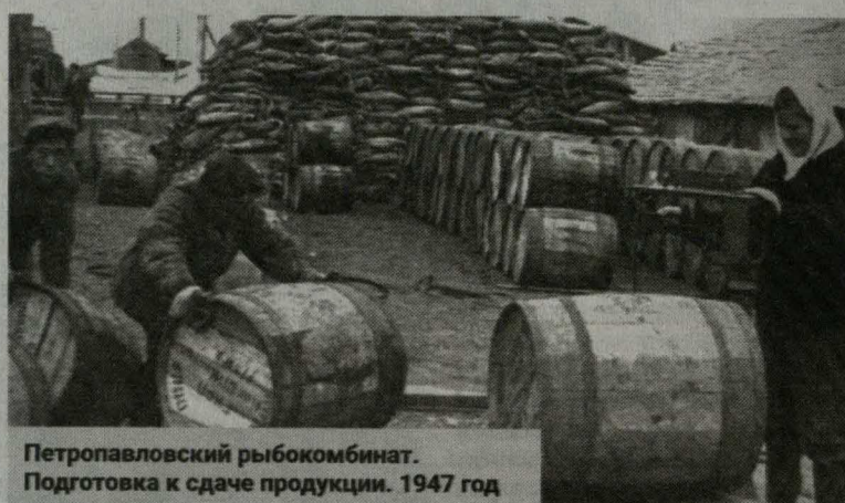
Петропавловский рыбокомбинат. Подготовка к сдаче продукции. 1947 год

России, Камчатского краевого объединенного музея, личного собрания автора. Читатель найдет в ней большое количество иллюстраций, часть которых опубликована впервые.