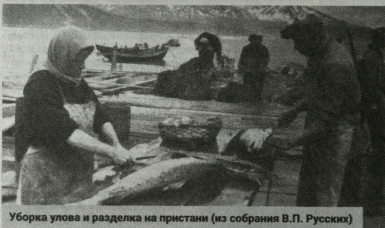
Уборка улова и разделка на пристани