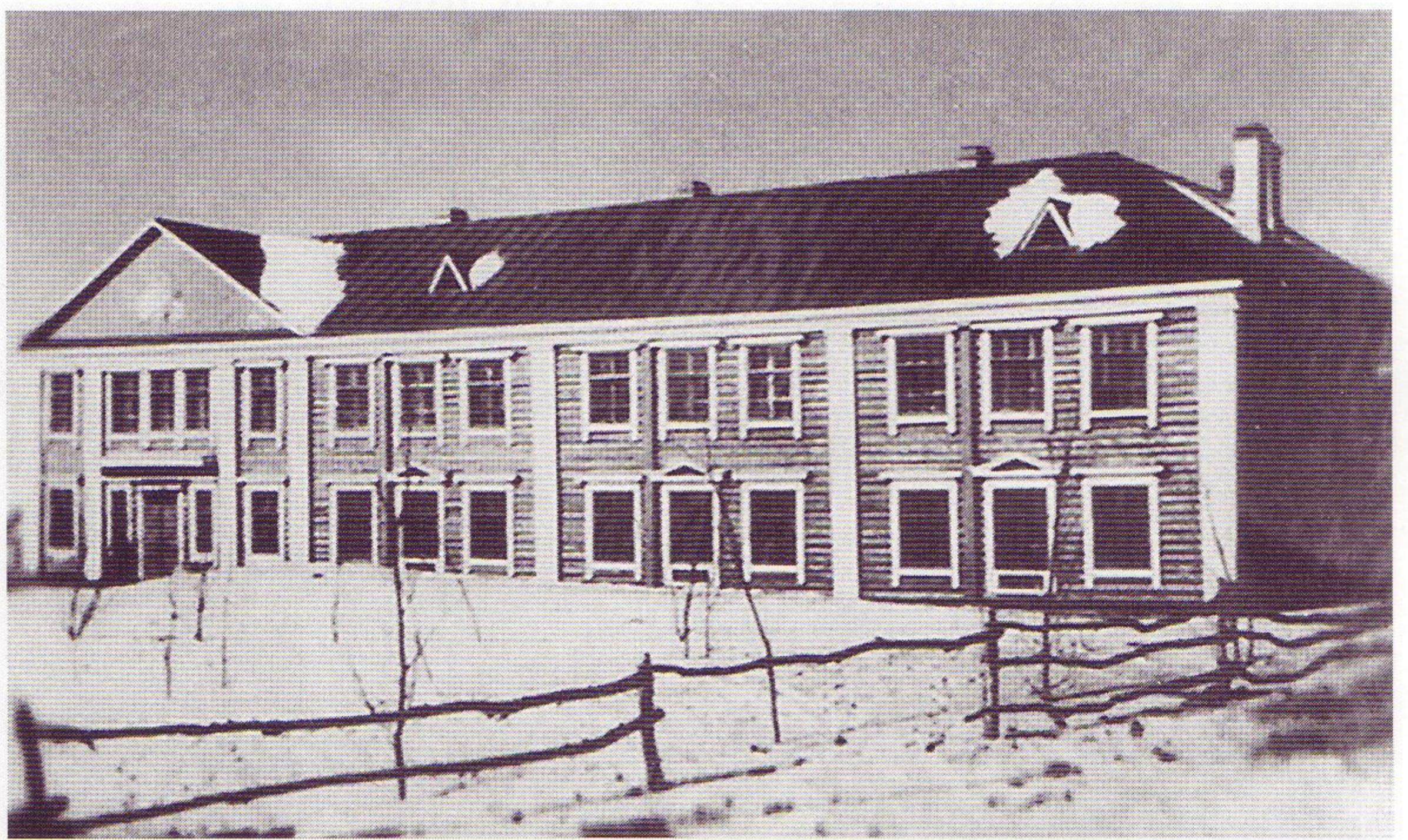
Средняя школа в Усть-Большерецке, 1957 год

С годами темп стройки нарастал, росло и качество. К концу 1960-х годов возводились уже только каменные дома. В 1968 году был сдан Дом культуры.