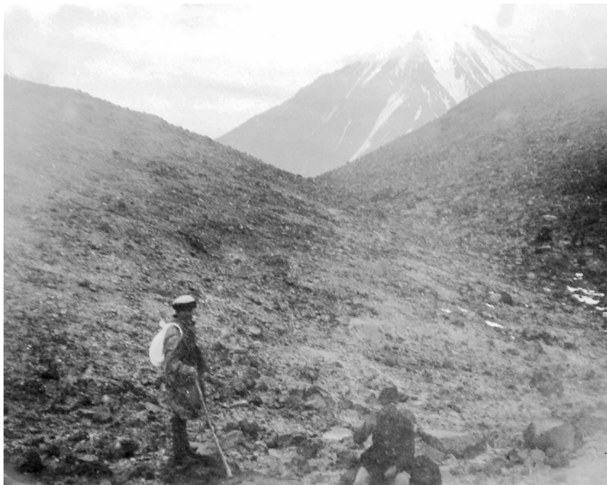
В. К. Арсеньев (сидит) во время восхождения на Авачинский вулкан. Август 1923 г.

Старый кратер был неглубок, «дно его покрыто обломками лавы величиной с конскую голову. Отовсюду поднимается бесчисленное множество мелких струй газа. Является впечатление, будто кратер недавно ещё был мокрым и не успел просохнуть, как следует, отчего со дна и поднимается пар. По всей внутренней поверхности кратера видны многочисленные белесовато-жёлтые пятна серы. Почва на дне его нагрета настолько сильно, что долго сидеть на одном месте нельзя. На глубине одного вершка под камнями рука не выдерживает температуру три-четыре секунды».