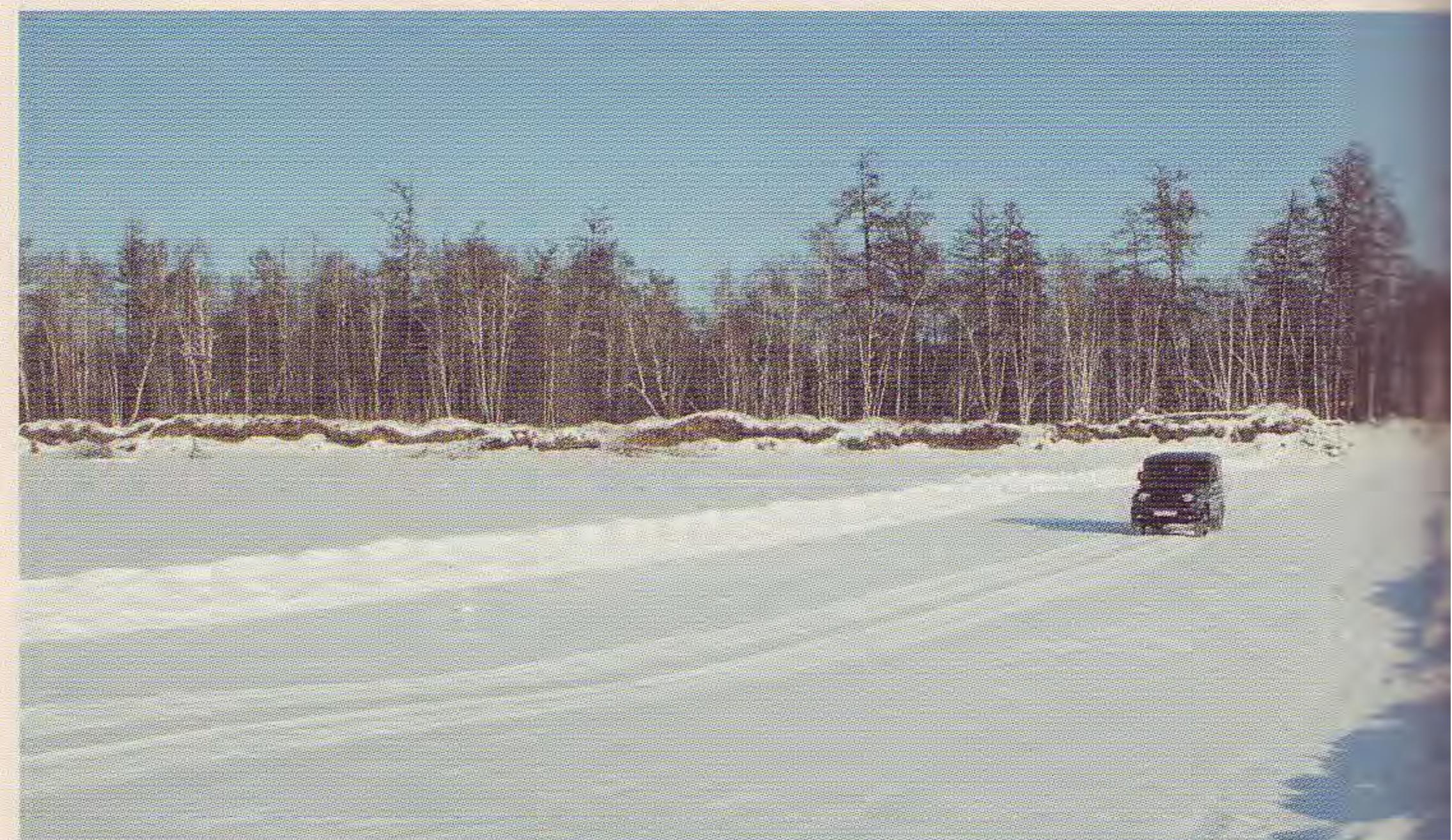
Ледовый мост через реку Камчатка

Сейчас в Таёжном проживает 118 человек. Основной вид занятий населения – охота, рыбалка, огородничество. Перспективу посёлка здесь видят в туризме и фермерстве.