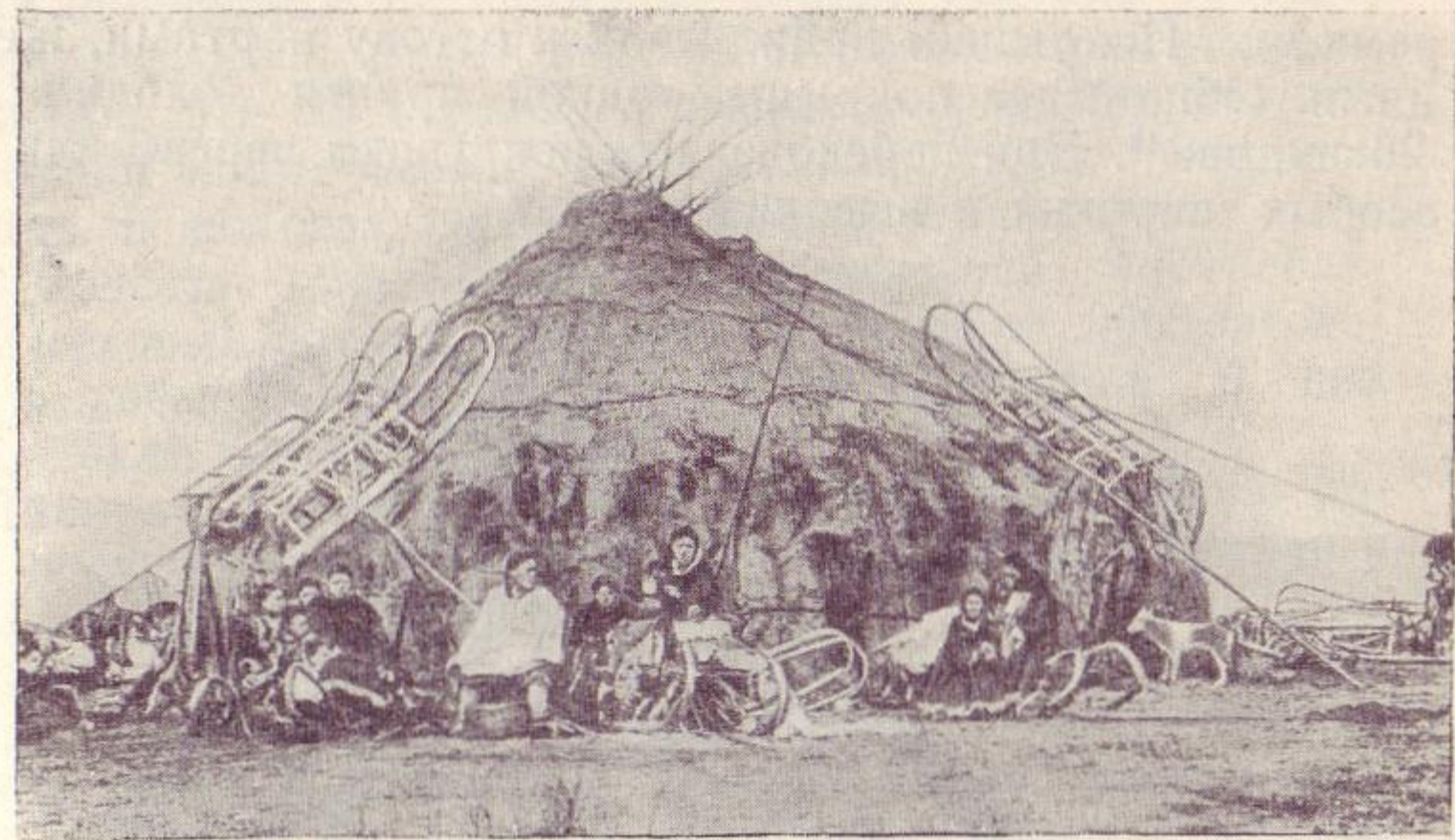
Рис. 1. Яранга кочевых коряков XIX в.

в прорубях осенью, ели в мерзлом, сыром виде. Для этого ее мелко строгали.