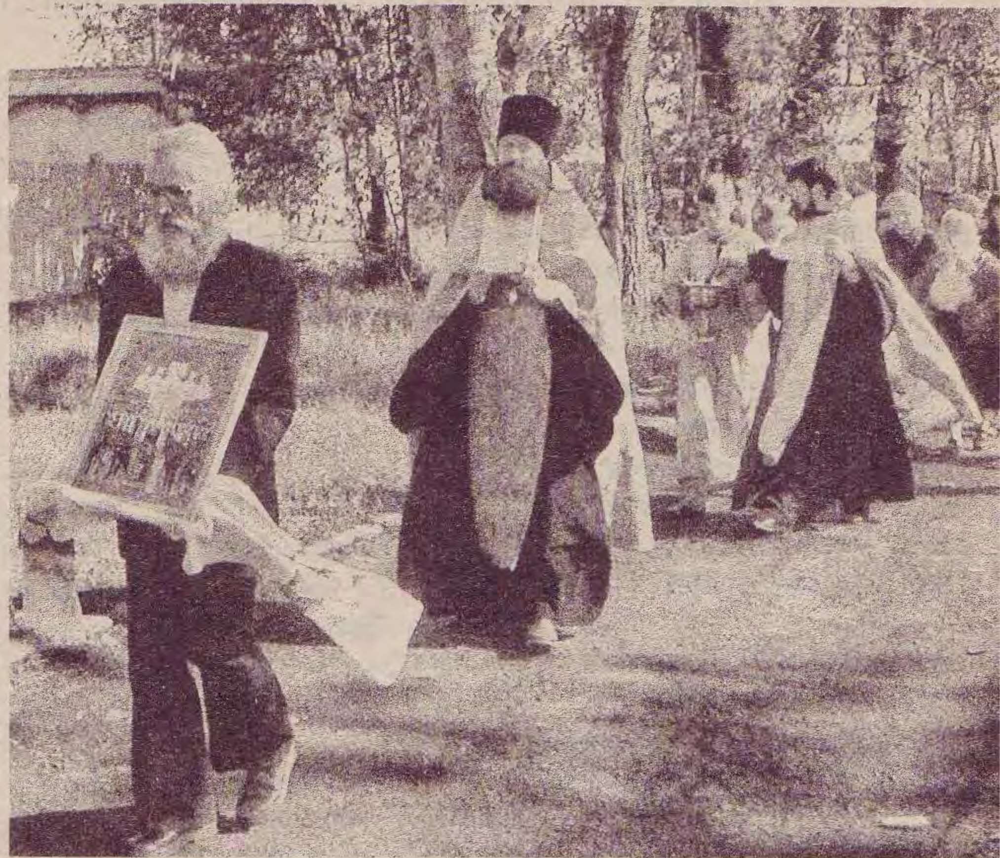
На снимке: крестный ход от Храма Богоявления к этнографическому музею.

Жаль только, что не все проголодавшиеся смогли унюхать запахи национальных блюд и обнаружить местечко, где всё это подавалось. Впрочем, и они могли побаловать себя порцией шашлыка, цивилизованно перекусить за столиками, расставленными там и сям. Большим успехом у гуляющих пользовались книжная ярмарка, выставка декоративно-прикладного искусства и живописи местных художников.