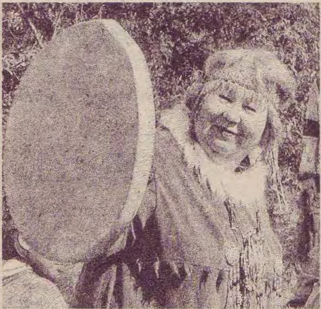
На снимке: встреча казаков, прибывших на землю камчатскую, с гостеприимными камчадалами

му настроению, люди веселились вовсю, кто во что горазд, будь то конкурс частушечников, спортив-