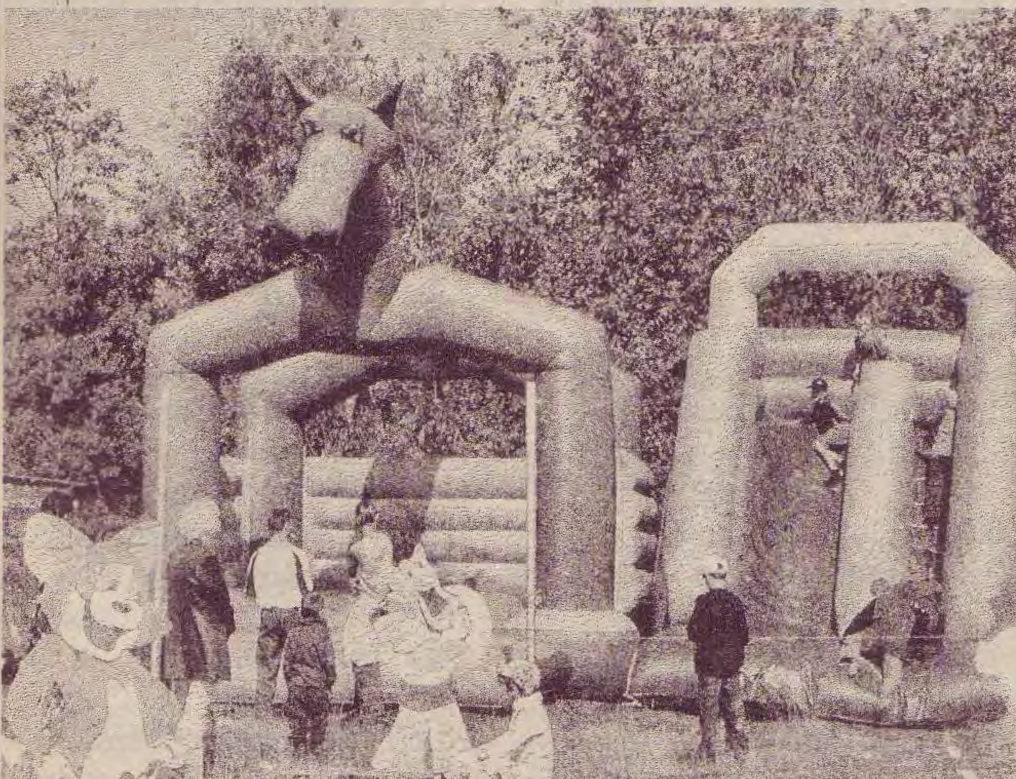
На снимке: «Детская площадка», вызвавшая восторги не только малышей, но и их родителей

Мастерицы кулинарного дела из клуба "Камчадалы" потчевали всех желающих отменной ушицей и всевозможными рыбными разносолами.