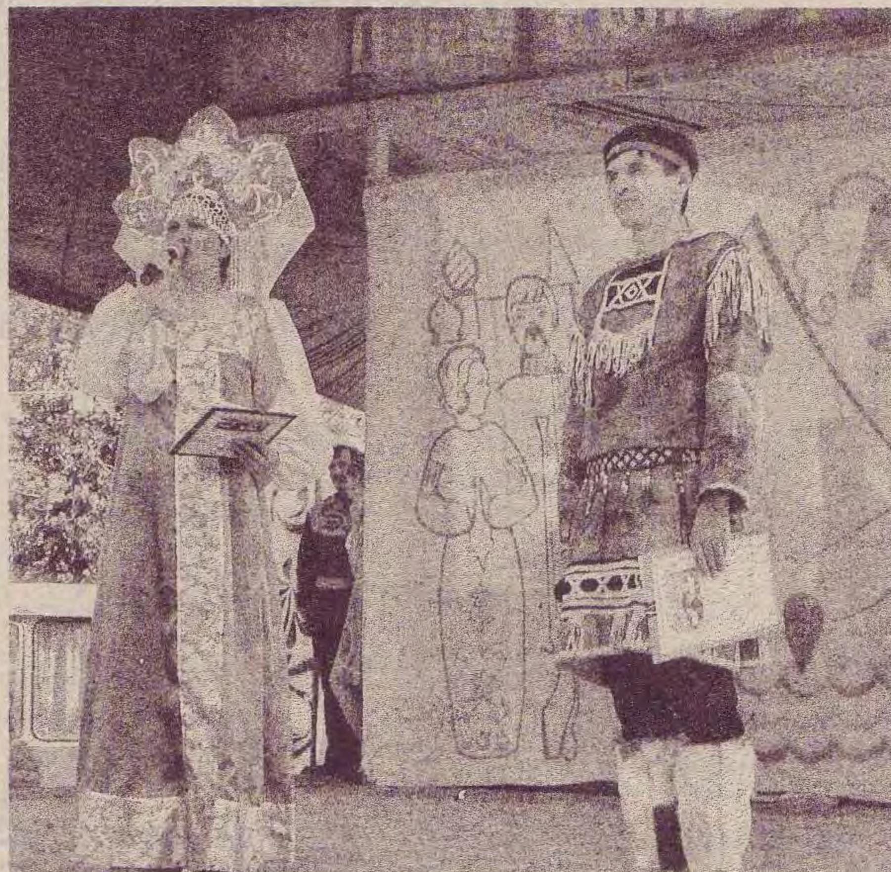
На снимке: открытие концертной программы. На сцене ведущие концерта.

В полночь над площадью с треском разлетелись раз-