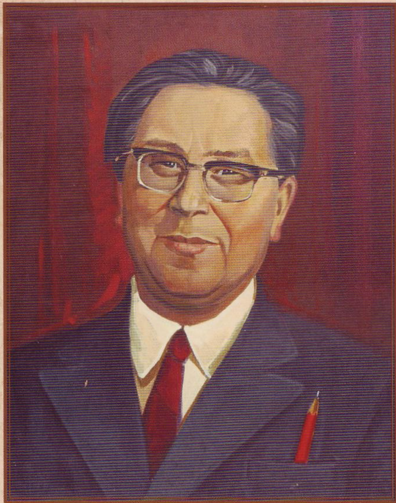
В. М. Тришкин. Георгий Германович Поротов. 1996. Холст, масло. 65×60